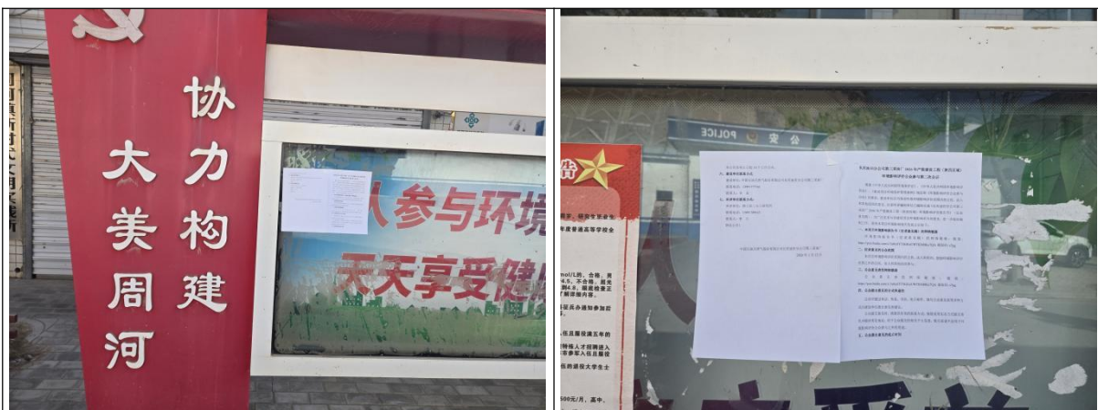
图1 周河村张贴公告照片