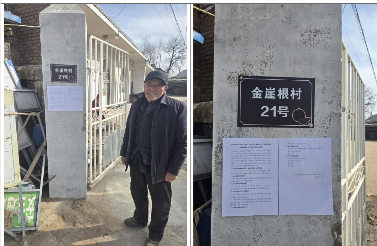
图2 金崖根村张贴公告照片