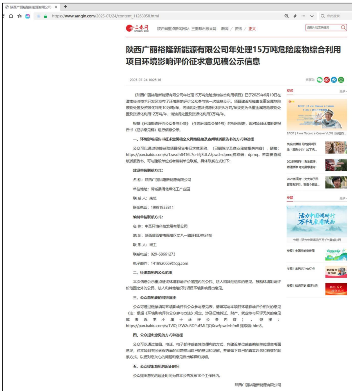
图 1 环评征求意见稿公示截图