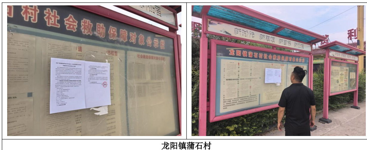
龙阳镇蒲石村 图 4 现场张贴公示照片