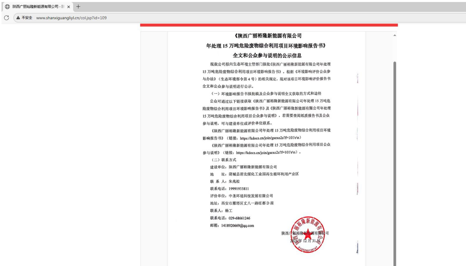
图 6 报批前网站公示截图