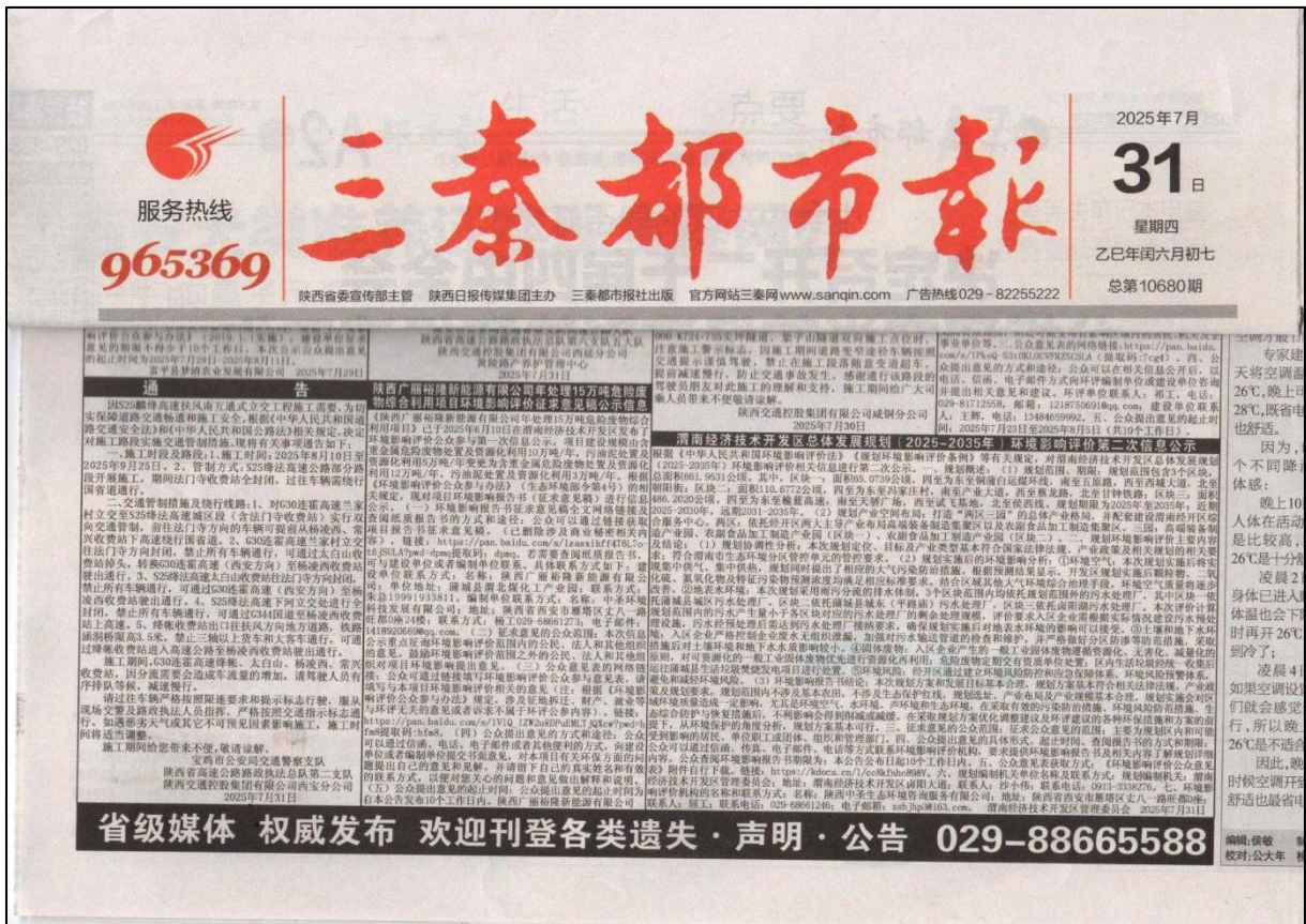
图3 7月31日报纸公示截图