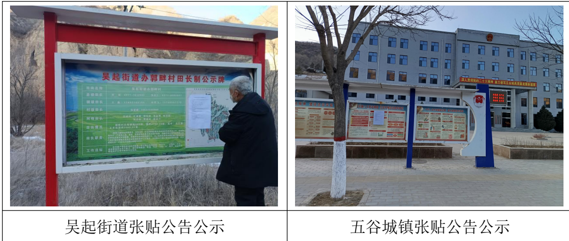
吴起街道张贴公告公示