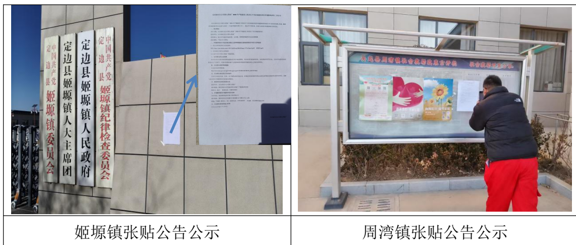
姬塬镇张贴公告公示

公示情况满足《环境影响评价公众参与办法》(生态环境部令〔2018〕第4号)要求。公示照片如下：