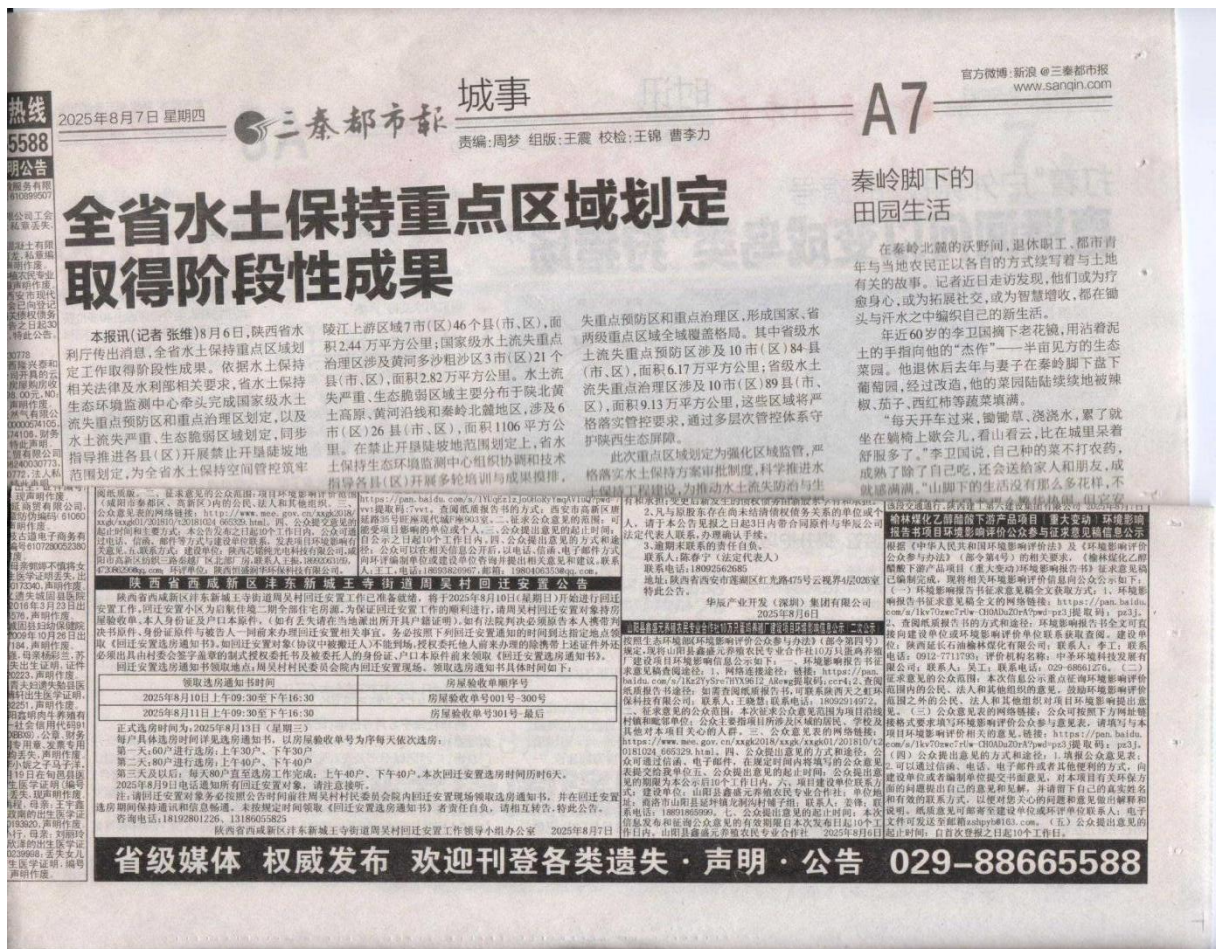
图 3.2-2 征求意见稿报纸公示 1