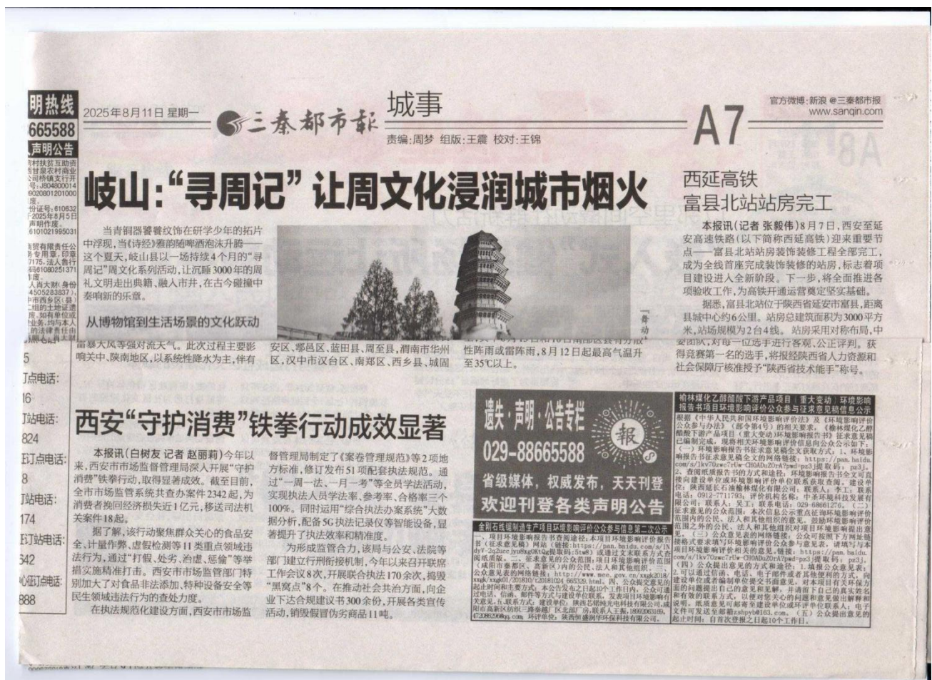
图 3.2-3 征求意见稿报纸公示 2