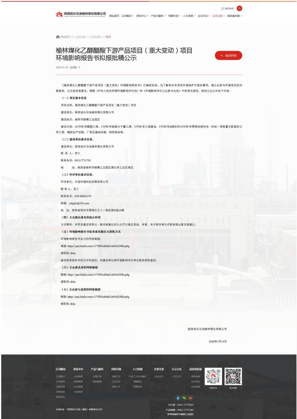
图 5-1 报批前公示