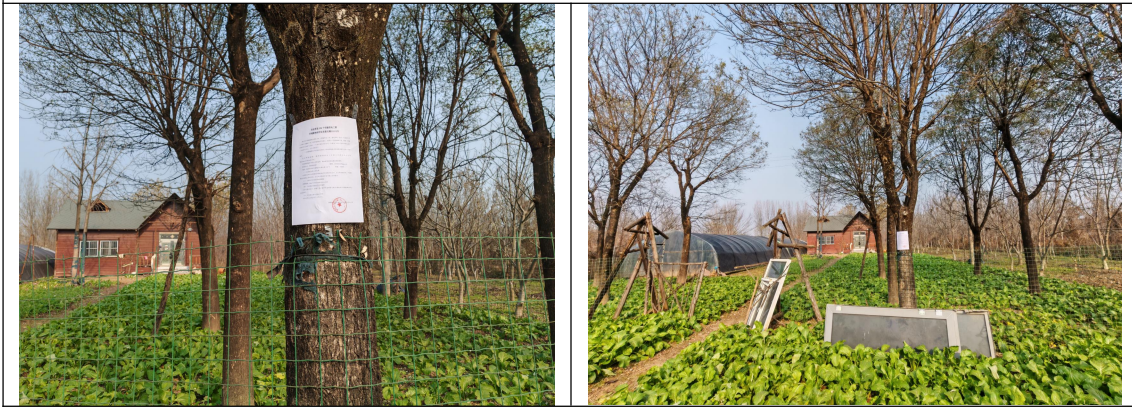
秦渡镇南沙河村住户