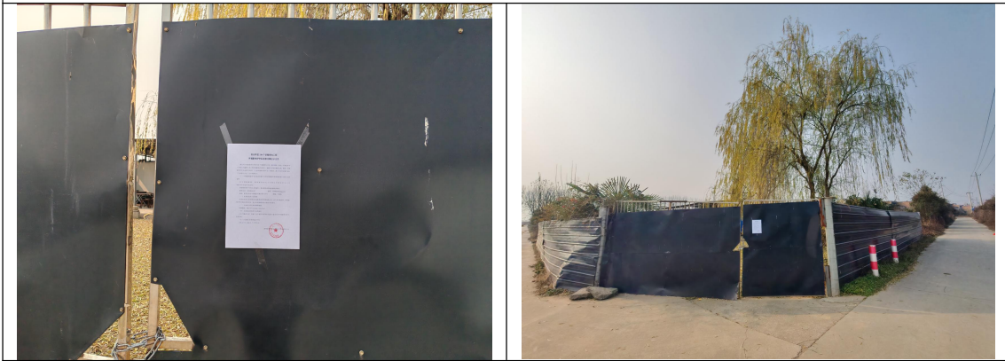
庞光镇姚家河村住户 2