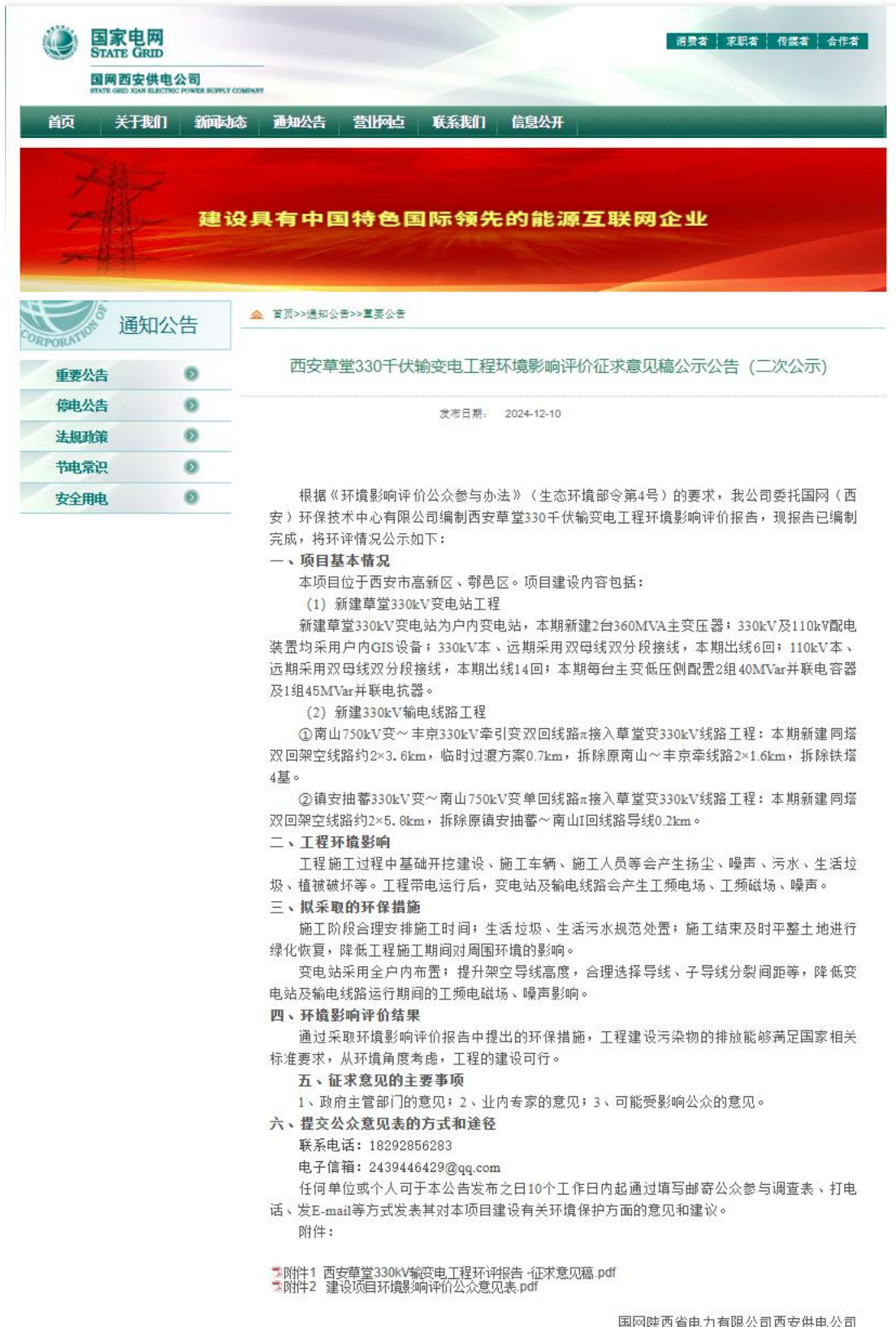
图 3.1 环境影响评价第二次信息公示（网络）