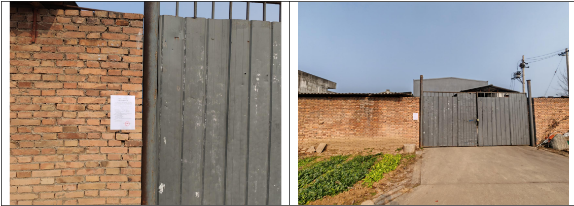
庞光镇姚家河村姚某文家