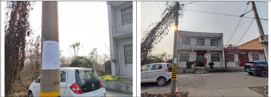
庞光镇姚家河村住户 1