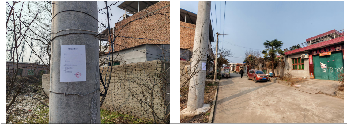
庞光镇姚家河村李某峰家