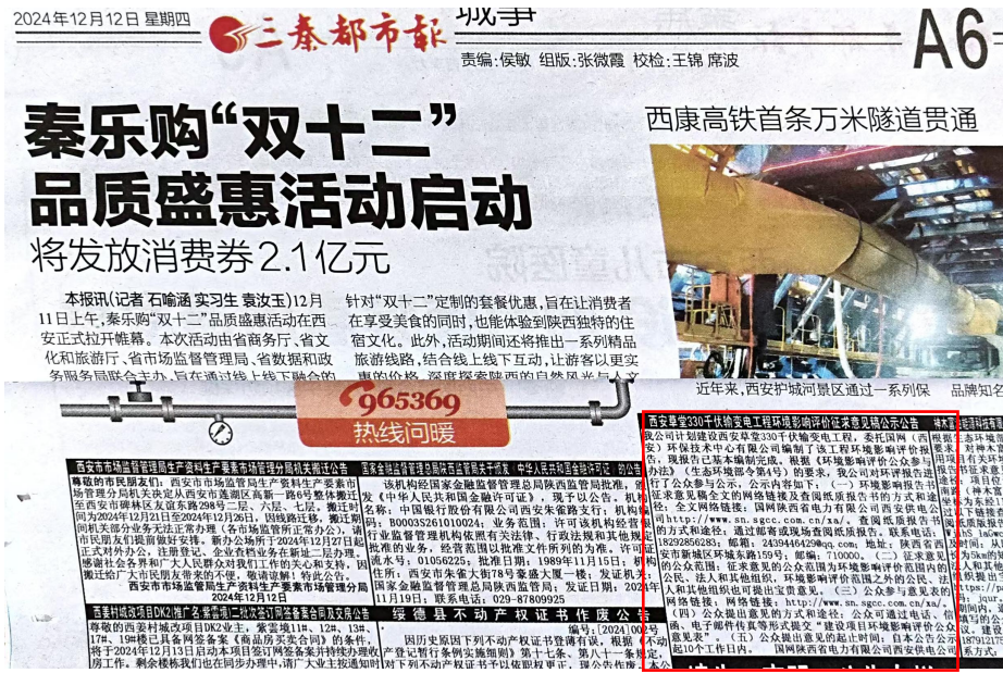
图 3.3 环境影响评价第二次信息公示情况（三秦都市报 2024 年 12 月 12 日版）