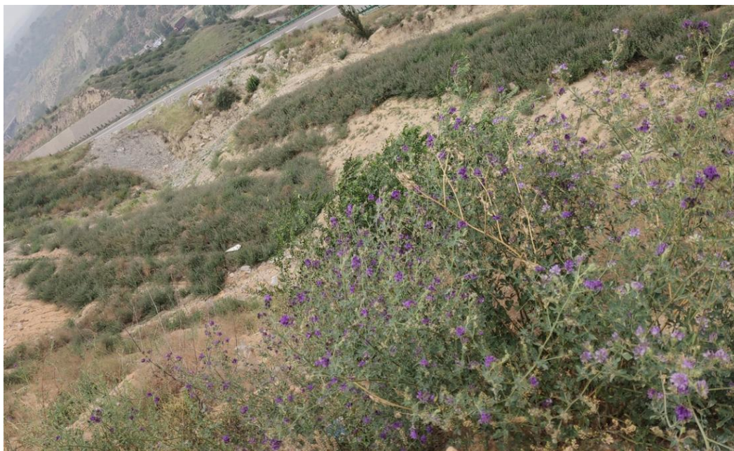
排土场边坡防护及生态恢复较好